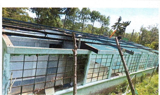
Foto 2: ÁREA DE LA PARTE DE ATRÁS DONDE SE ESTÁ REALIZANDO EL MEJORAMIENTO DE TECHO, MANTENIMIENTO DE COSTANERAS Y MEJORAMIENTO DE CANALETAS CON SU RESPECTIVA CAIDA DE AGUA.