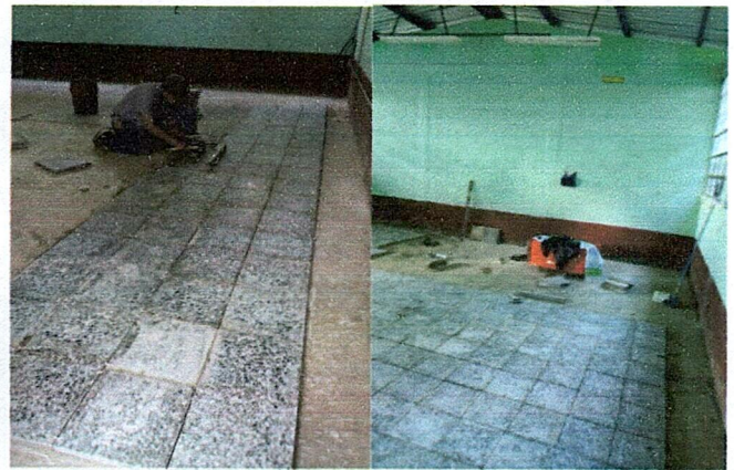
Foto 3: ÁREA DONDE SE ESTÁ REALIZANDO EL MEJORAMIENTO DE PISO E INSTALACIÓN DE TIPO GRANITO.